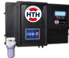
HTH™ CYCL'EAU Erstes Steuerungssystem

Die Kombination dieser drei HTH-Produkte garantiert eine regulierte, zuverlässige und einfache Desinfektion und ermöglicht die vollständige und sichere Automatisierung Ihrer Poolbehandlung.