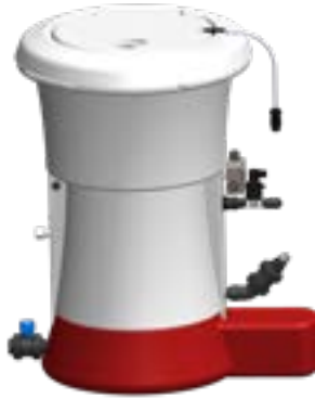
HTH™ EASIFLO™ Dosierer