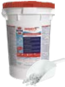
HTH™ EASIFLO™ BRIQUETTES