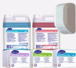
Control de olores