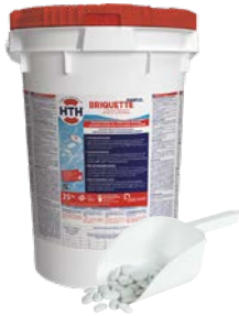
BRIQUETAS HTH™ EASIFLO™