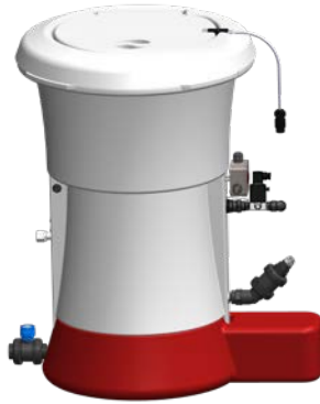
DOSIFICADOR HTH™ EASIFLO™