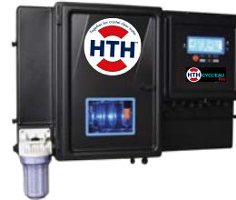
Sistema de control HTH™ CYCL'EAU

La combinación de estos 3 productos HTH garantiza una desinfección regulada, fiable y sencilla, permitiendo la automatización completa y segura del tratamiento de su piscina.