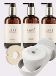
Les soins personnels

Car chaque détail qu'ils remarquent reflète les normes de la marque que vous respectez