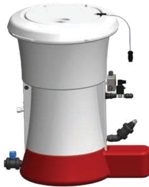
Distributeur HTH™ EASIFLO™