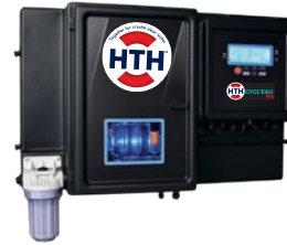
HTH™ CYCL'EAU Premier système de contrôle

La combinaison de ces 3 produits HTH garantit une désinfection réglementée, fiable et simple, permettant une automatisation complète et sécurisée du traitement de votre piscine.