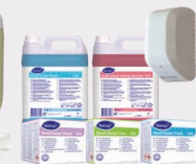
Le contrôle des odeurs