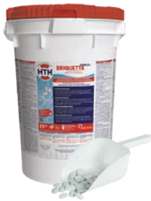
BRIQUETTES HTH™ EASIFLO™